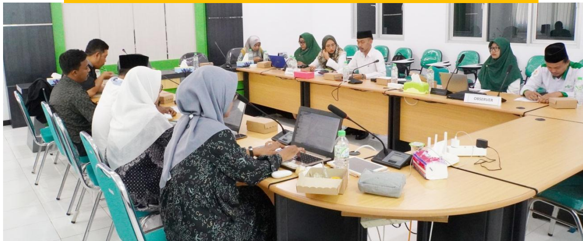
Proses audit standar 1-8 penelitian dan pengabdian kepada masvarakat