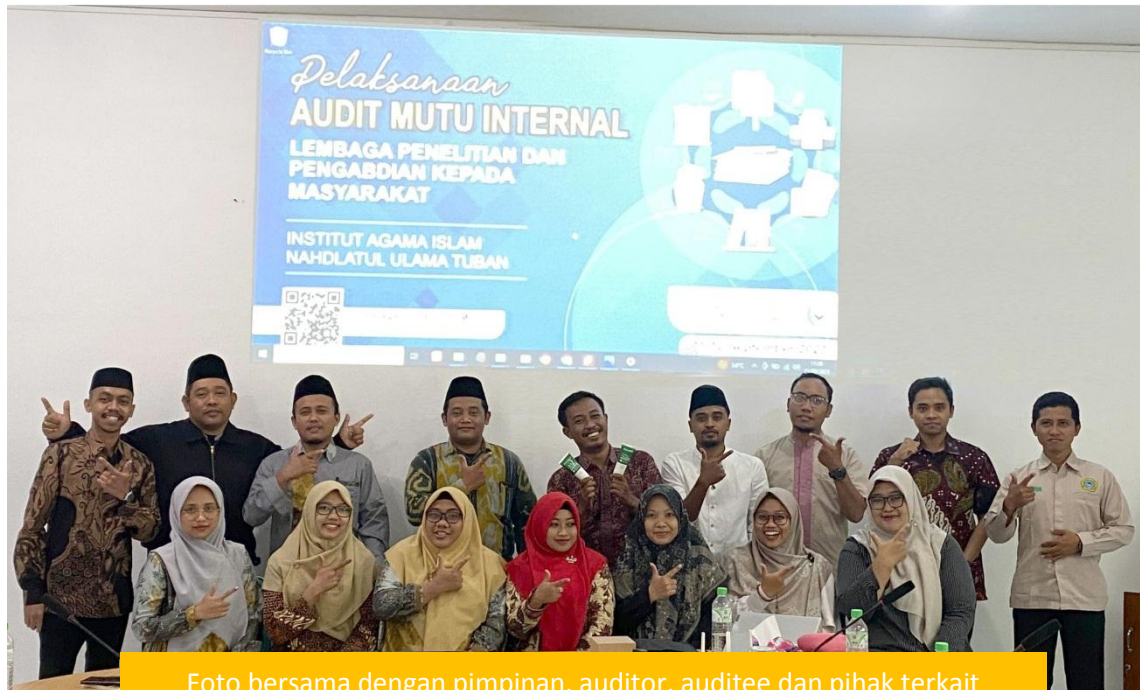
Foto bersama dengan pimpinan, auditor, auditee dan pihak terkait