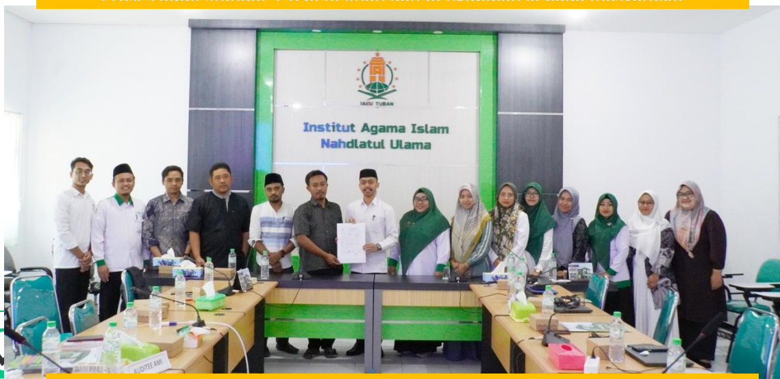
Penutupan dan Penandatanganan PTK oleh Auditor dan Auditee